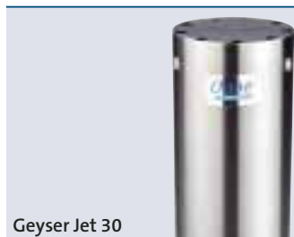
Geysir Jet 30