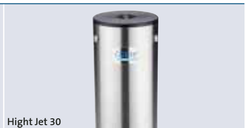
High Jet 30