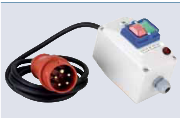
CEE-Stecker + Schutzschalter Die 400-V-Version wird anschlussfertig mit 5poligem CEE-Stecker und Motorschutzschalter geliefert