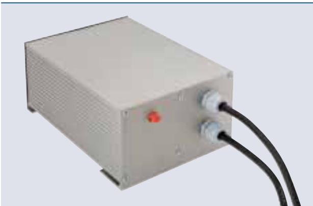
Schuko-Stecker und Control Box Die 230-V-Version wird betriebsfertig mit Control Box und Schuko-Stecker geliefert.

Zwei verschiedene Motorleistungsgrößen mit richtlinienkonformem Schuko-Stecker (230 V) und Motorschutzschalter bzw. CEE-Stecker (400 V) bieten Lösungen für unterschiedliche Gewässer und Gegebenheiten. Ein optimierter Wasserdruck sorgt für beeindruckende Höhen der vier verfügbaren Düsenbilder mit 3"-Standardgewinde, die im Handumdrehen gewechselt sind. Das einfach zu installierende LunAqua 10 LED/01 Beleuchtungsset sorgt für eine beeindruckende Ausleuchtung des bis zu 16,5 m hohen Wasserbildes.