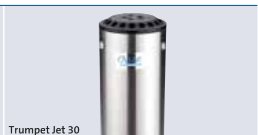
Trumpet Jet 30